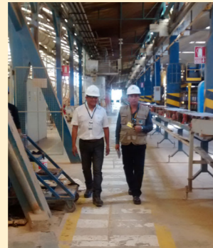
Auditoría de Recertificación a la empresa "Corporación Cerámica S.A."

BASC PERÚ realizó 58 auditorías a nivel nacional en el mes de marzo, dentro de las cuales se tuvo: 44 Auditorías de Recertificación, 06 Auditorías de Certificación, 04 Auditorías de Control, 02 Registros iniciales y 02 Auditorías Complementarias, con el fin de verificar la implementación y el mantenimiento del Sistema de Gestión en Control y Seguridad (SGCS) BASC, respecto a la Norma BASC y el Estándar correspondiente.