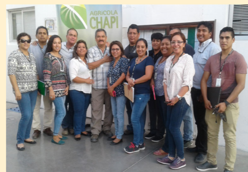
Auditoría de Recertificación a la empresa "Agrícola Chapi S.A.", en su sede de Ica.